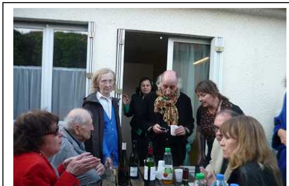
Le temps de l'apéritif au Temps des cerises (mai 2015)