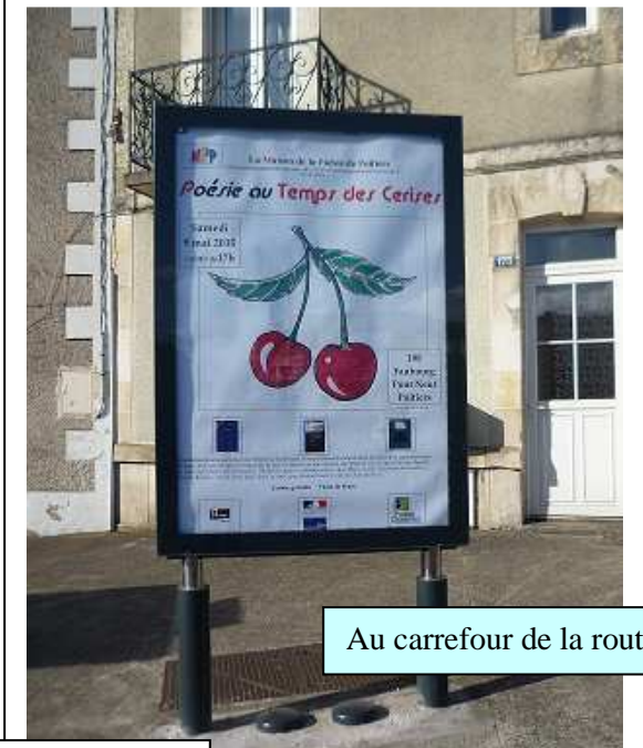
Au carrefour de la route de Gençay et du Faubourg Pont Neuf