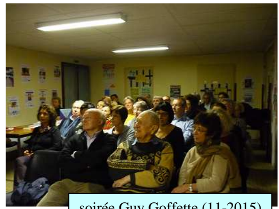
soirée Guy Goffette (11-2015)