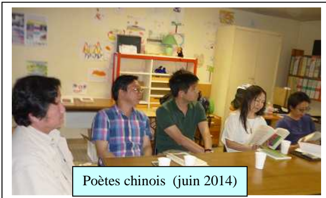
Poètes chinois (juin 2014)