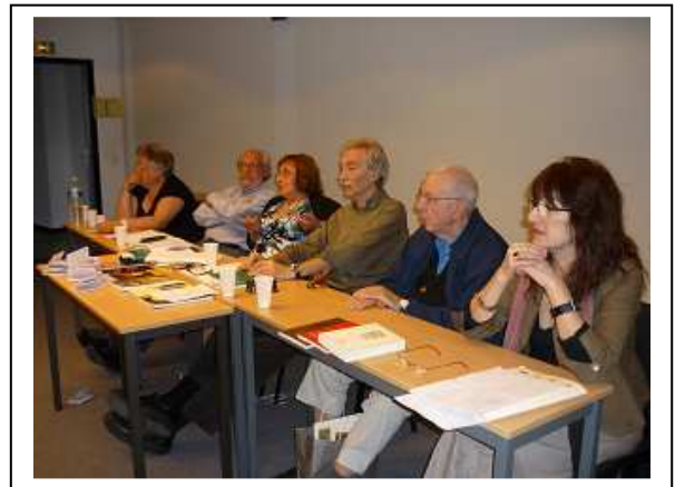
Poètes argentins à la MSHS (mai 2011)