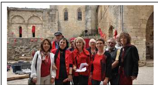
La MPP avec le foyer rural de Verrines au festival Le monde à l'envers 2014 (Abbaye de Celles sur Belle)